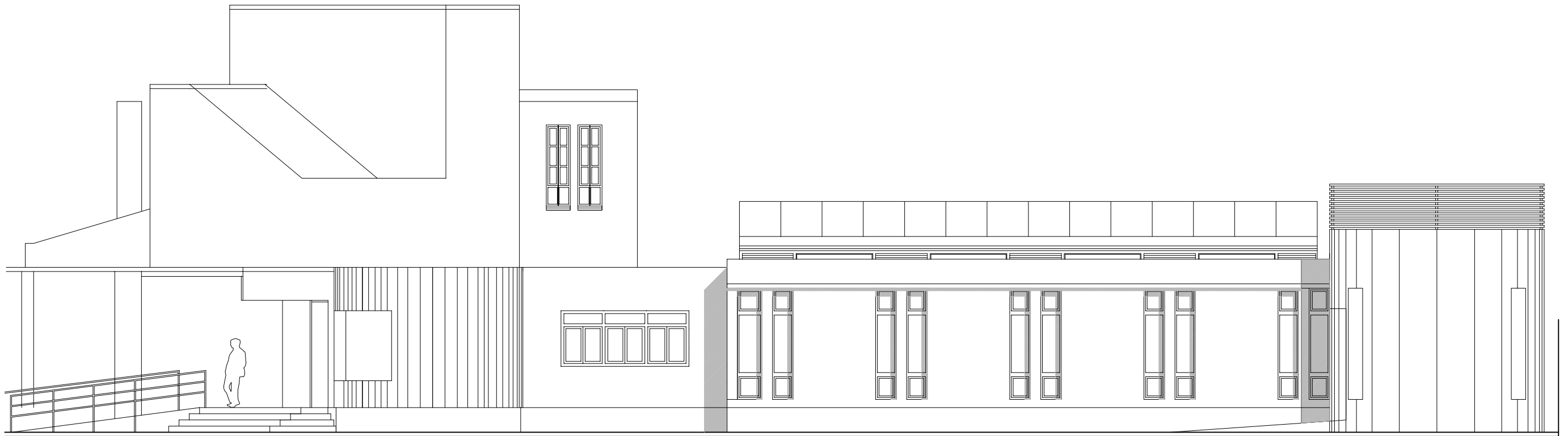
ALZADO SEDE SOCIAL

ESTE PLANO SUSTITUYE AL A2 DEL REFORMADO DE PROYECTO